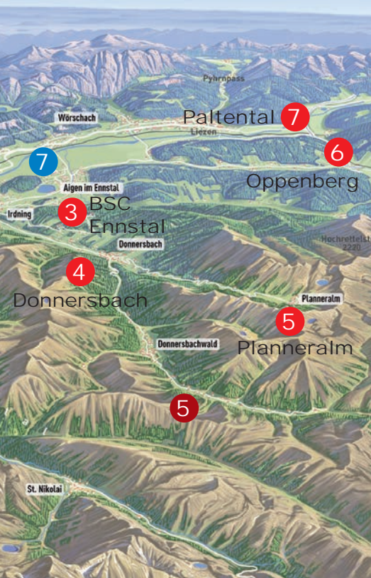
Bild: Schladming / Dachstein