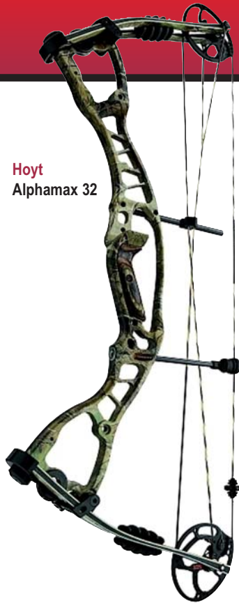
Hoyt Alphamax 32

Pro sind beide 41 Zoll lang und unterscheiden sich nur in einem Punkt, nämlich der Shoot-Through Technology, die bei früheren Modellen auch schon zum Einsatz gekommen ist. Beide Bögen haben eine Aufspannhöhe von 7,75 Zoll und eine Geschwindigkeit von 308 fps nach IBO.