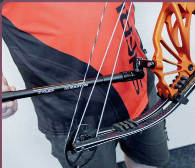
Z-Flex Heck-Stabi mit Shrewd Seitenausleger und reichlich Gewicht