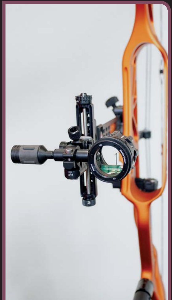
Shrewd Scope mit hochwertiger Feather Vision Linse und montiertem Scopedämpfer von Doinker.