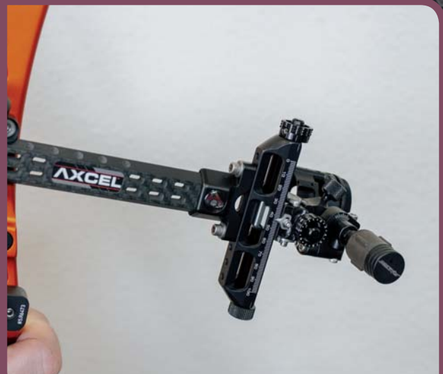
Axcel Achieve Carbon, eines der leichtesten und stabilsten Visiere am Markt.